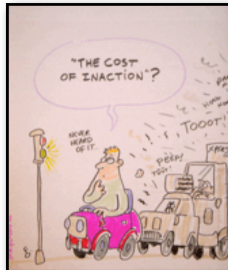
¿El costo de la in-acción? nunca había escuchado esto

Los donantes han participado activamente en la construcción y gobierno del Fondo Mundial, promoviendo políticas y una arquitectura progresista junto a los países implementadores y la sociedad civil. Los recursos financieros existen y se vienen ubicando en forma copiosa en otros temas alejados de la salud global. ¿Existirá la voluntad política de hacer lo correcto?